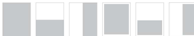
1/1 Seite 210 x 297 mm | 1/2 Seite quer 210 x 140 mm | 1/2 Seite hoch 110 x 297 mm | 1/1 Seite 180 x 273 mm | 1/2 Seite quer 165 x 130 mm | 1/2 Seite hoch 85 x 273 mm