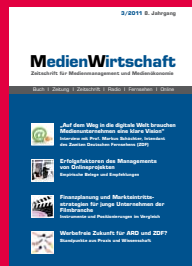
Zeitschrift für Medienmanagement und Kommunikationsökonomie www.medienwirtschaftonline.de