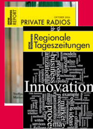
new business Reports