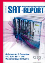
Fachmagazin für SAT, Kabel, Antenne und Multimedia www.sat-report.de