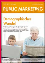
Das Magazin für Kommunikation im öffentlichen Sektor www.publicmarketing.eu