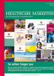
Das Entscheider-Magazin für Pharma-Marketing www.healthcaremarketing.eu