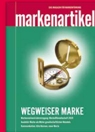
Das Magazin für Markenführung www.markenartikel-magazin.de