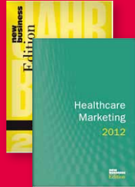
new business Edition www.jahrbuch-sponsoring.de www.healthcaremarketing.eu