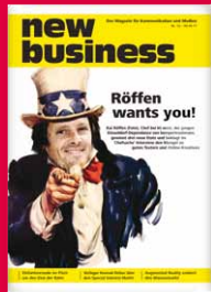
Das Magazin für Kommunikation und Medien www.new-business.de