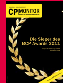
Das Magazin für Corporate Communications www.cp-monitor.de