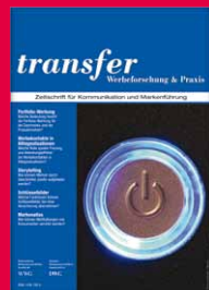
Zeitschrift für Werbung, Kommunikation und Markenführung www.transferzeitschrift.net