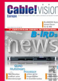
Business-Magazin für Kabel, Satellit, Breitband und digitales Fernsehen www.cablevision-europe.de