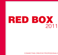
Connecting Creative Professionals www.redbox.de