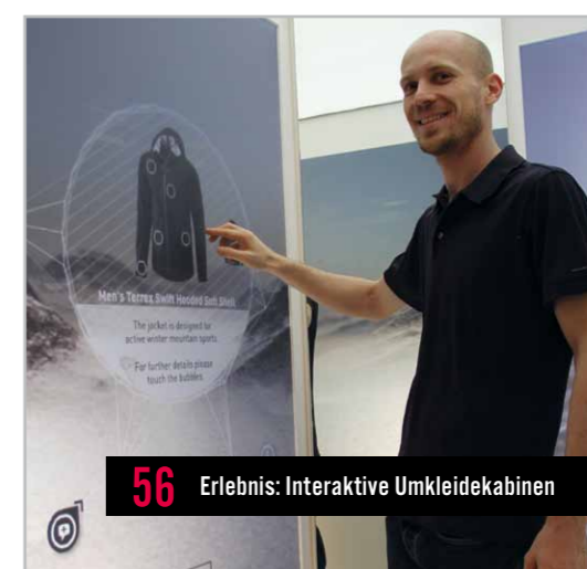
56 Erlebnis: Interaktive Umkleidekabinen