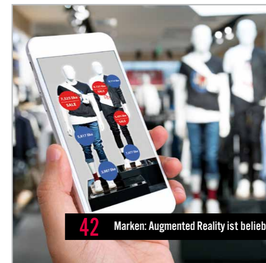
42 Marken: Augmented Reality ist beliebt

Täglich Marken-News auf unserer Website www.markenartikel-magazin.de und auf Twitter unter @markenartikler