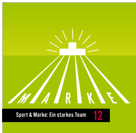
Sport & Marke: Ein starkes Team 12