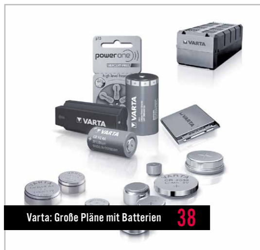
Varta: Große Pläne mit Batterien 38