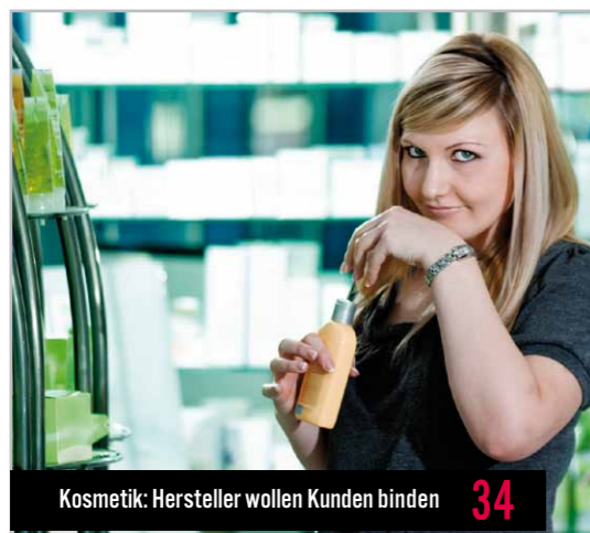
Kosmetik: Hersteller wollen Kunden binden 34