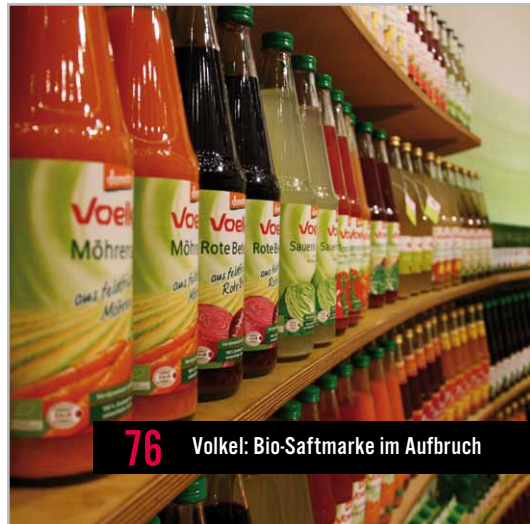
76 Volkel: Bio-Saftmarke im Aufbruch