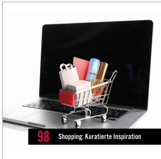
98 Shopping: Kuratierte Inspiration