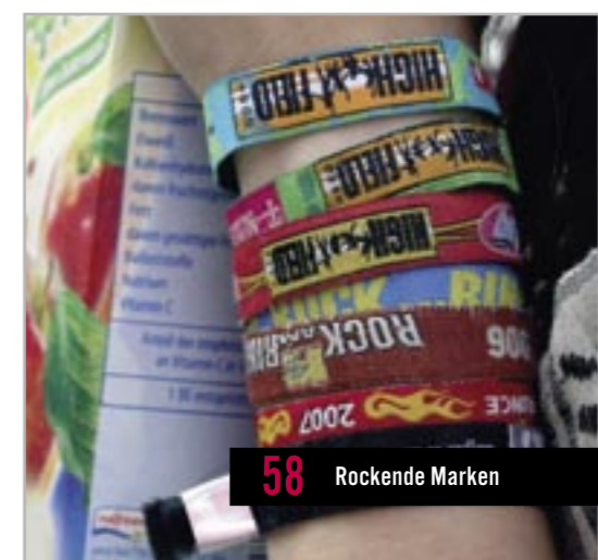
58 Rockende Marken