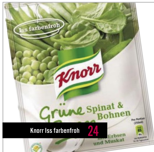
Knorr Iss farbenfroh 24