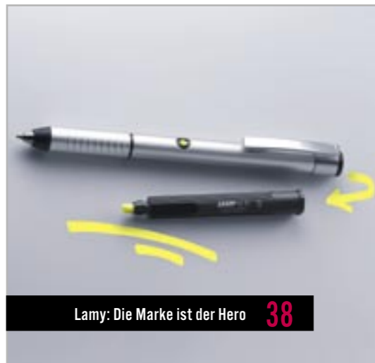
Lamy: Die Marke ist der Hero 38