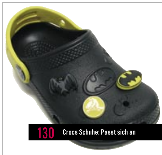
130 Crocs Schuhe: Passt sich an