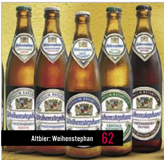
Altbier: Weihenstephan 62