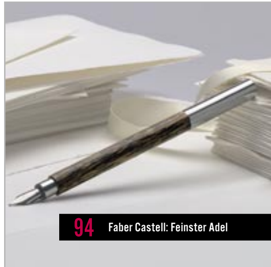
94 Faber Castell: Feinster Adel