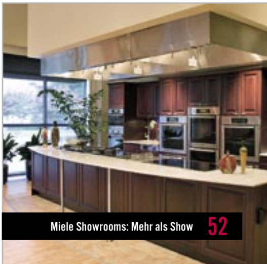
Miele Showrooms: Mehr als Show 52