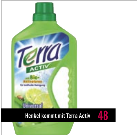
Henkel kommt mit Terra Activ 48